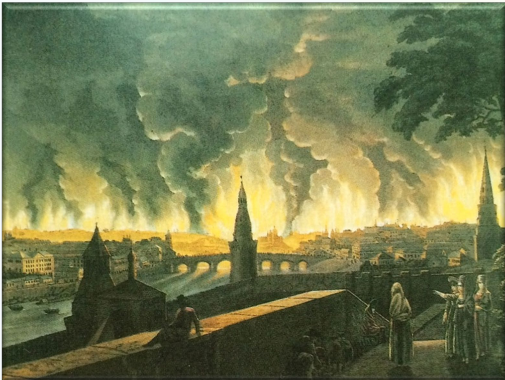
И.К.Айвазовский Пожар Москвы 1812г.

В 1816 г. получил звание архитектора. При организации в Москве специальной Комиссии для строений, задачей которой было восстановление столицы после пожара 1812 г., Бове вошёл в её состав. Вскоре он стал одним из ведущих мастеров и ведал «фасадической частью» жилого строительства.