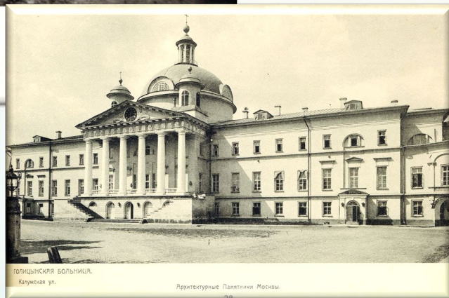
ГОЛИЦЫНСКАЯ БОЛЬНИЦА, Калу́жская ул.