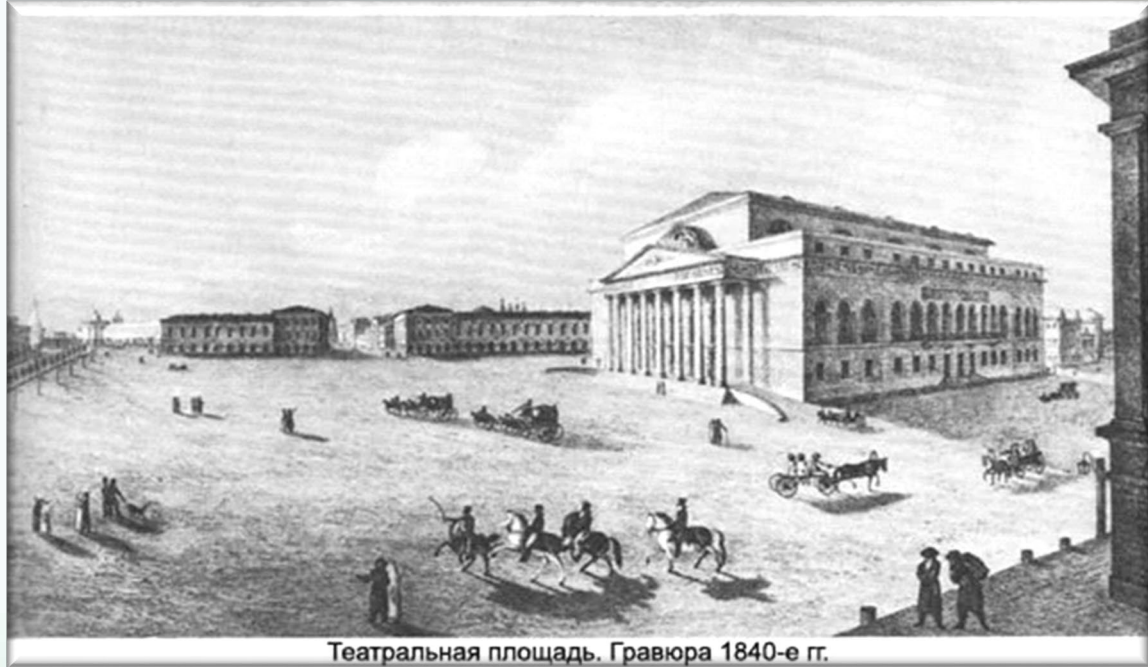
Театральная площадь. Гравюра 1840-е гг.

При создании Театральной площади Бове выполнил проект нового каменного Большого театра и перепланировал близлежащую территорию (1821—1824 гг.).