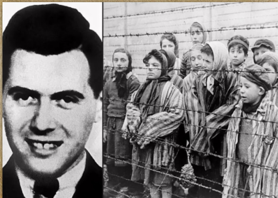
Доктор Менгеле — обыкновенный фашист

Он проводил в концлагере эксперименты, которые, по его словам, были направлены на увеличение рождаемости и уменьшение числа генетических отклонений у арийской расы. Об этих экспериментах до сих пор с ужасом вспоминают люди прошедшие этот ад.