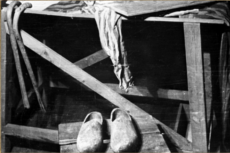
Освенцим. Скамья для экзекуций.

Заключённых день за днём кормили баландой из гнилых овощей. Узники говорили вновь прибывшим: «Кто продержится на гнилье и почти без сна три месяца, тот сможет прожить здесь и год, и два, и три». Но таких «счастливчиков» были единицы... В конце 1944 года, когда советские войска были недалеко от Освенцима, лагерное начальство объявило эвакуацию заключённых на территорию Германии.