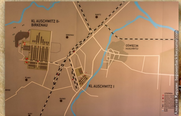
Схема расположения лагерей