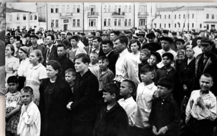
Жители Владивостока слушают сообщение о нападении Германии на СССР