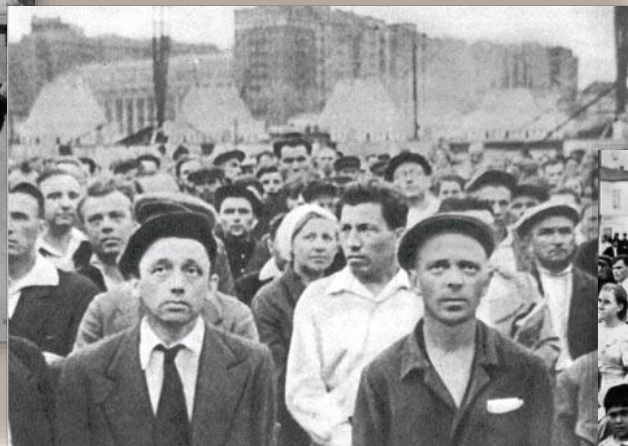
Москва, Волхонка. 22.06.1941 9 часов утра.