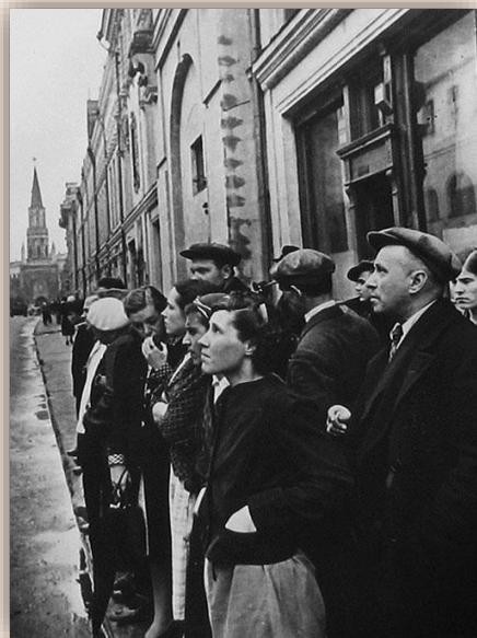
Первый день войны. 22-июня 1941года.

75 лет назад, 22 июня 1941 года, началась Великая Отечественная война, унесшая жизни десятков миллионов советских людей. Первые дни самой страшной в истории человечества войны