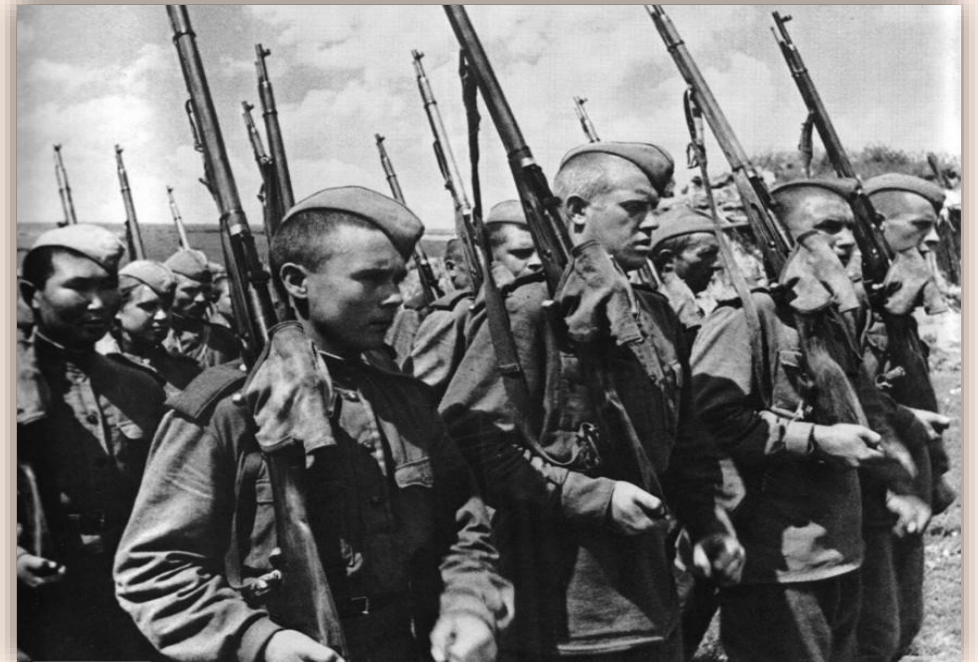
Вооружение советских солдат 1941 г.