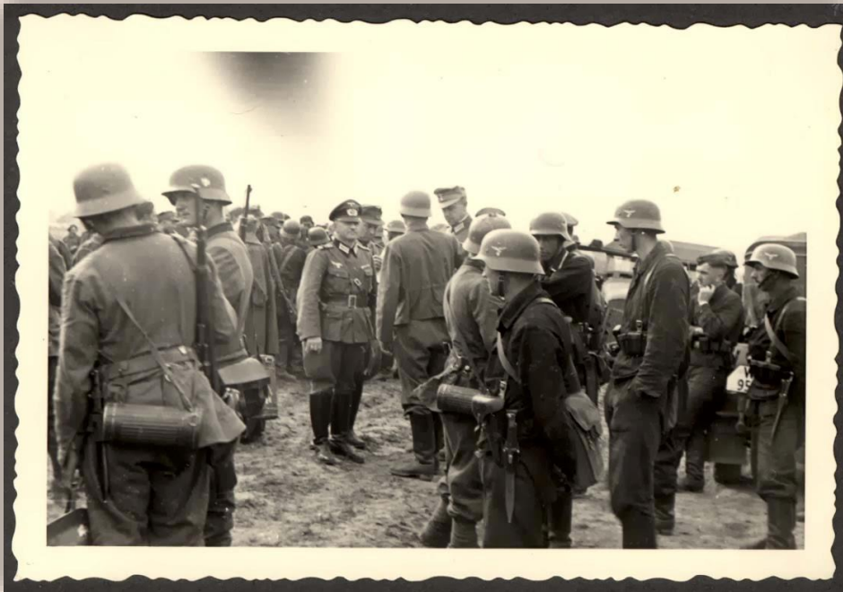
Вооружение немецких солдат 1941 г.

Принимая решение о развязывании войны с СССР и делая ставку на «молниеносность», германское руководство намеривалось завершить ее к зиме 1941 г. В соответствии с планом «Барбаросса» у границ СССР была развернута гигантская армада отборных, хорошо обученных и вооруженных войск. Германский генеральный штаб сделал главную ставку на сокрушающую мощь внезапного первого удара, стремительность броска концентрированных сил авиации, танков и пехоты к жизненно важным политическим и экономическим центрам страны.