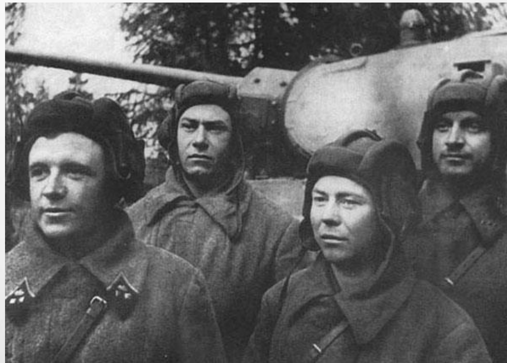
Танковый экипаж Д. Лавриненко (крайний слева). Октябрь 1941 г.

СВОЙ ПОСЛЕДНИЙ ТАНК ЛАВРИНЕНКО ПОДЕЛИЛ 18 ДЕКАБРЯ 1941 Г. У ДЕРЕВНИ АНИНО ВОЛГОГРАДСКОГО РАЙОНА. В ЭТОМ ЖЕ БОЮ ОН БЫЛ УБИТ ОСКОЛКОМ МИНОМЕТНОЙ МИНЫ. ВСЕГО ЗА ДВЕ НЕДЕЛИ ДО СМЕРТИ 30 НОЯБРЯ, ОН НАПИСАЛ ДРОМОЙ «ПРОКЛЯТЫЙ ВРАГ ВСЕ СТРЕМИТСЯ К МОСКВЕ, НО ЕМУ НЕ ДРОЙТИ ДО МОСКВЫ! ОН БУДЕТ РАЗБИТ. НЕДАЛЕК ТОТ ЧАС, КОГДА МЫ БУДЕМ ЕГО ПНАТЬ И ПНАТЬ, ДА ТАК, ЧТО ОН НЕ БУДЕТ ЗНАТЬ, КУДА ЕМУ ДЕВАТЬСЯ... ПОГИБАТЬ НЕ СОБИРАЮСЬ».