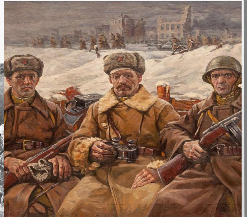
Битва за Москву . Второй Наступательный период. Контрнаступление начало 5 декабря 1941г. — 30 марта 1942г.)